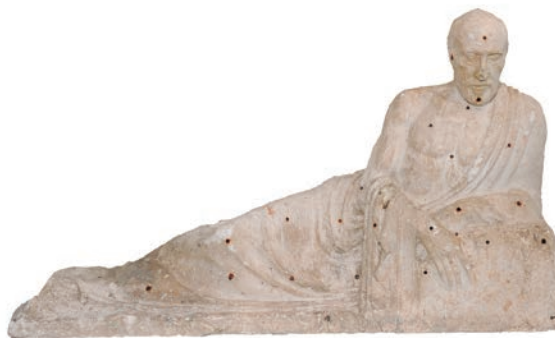
Boceto del Monumento a Ramón y Cajal. Yeso. Ayuntamiento de Palencia

Del 26 de noviembre de 2016 al 29 de enero de 2017