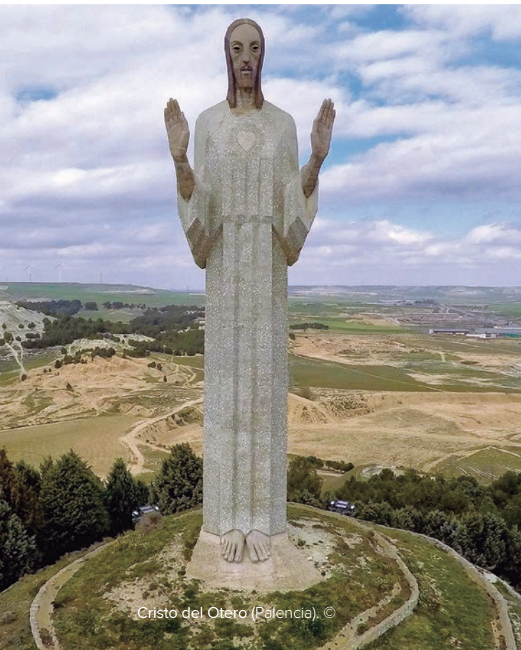
Cristo del Otero (Palencia). ©

En su casa taller de Toledo, Roca Tarpeya, conservaba dibujos, bocetos, estudios, y réplicas de algunas de sus obras. Muchas de ellas forman parte del Museo de Victorio Macho en Toledo, y en el Centro de Interpretación de su obra en Palencia se conservan también otras, junto a los materiales preparatorios para la realización de las obras palentinas. Parte de toda esta producción puede verse también en esta exposición como muestra del proceso creativo del escultor.