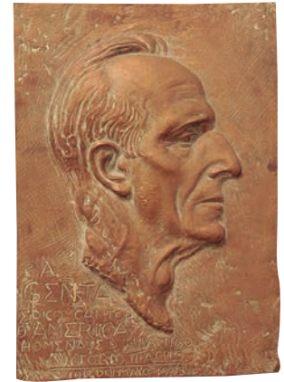
Genta Bronce Diputación de Palencia