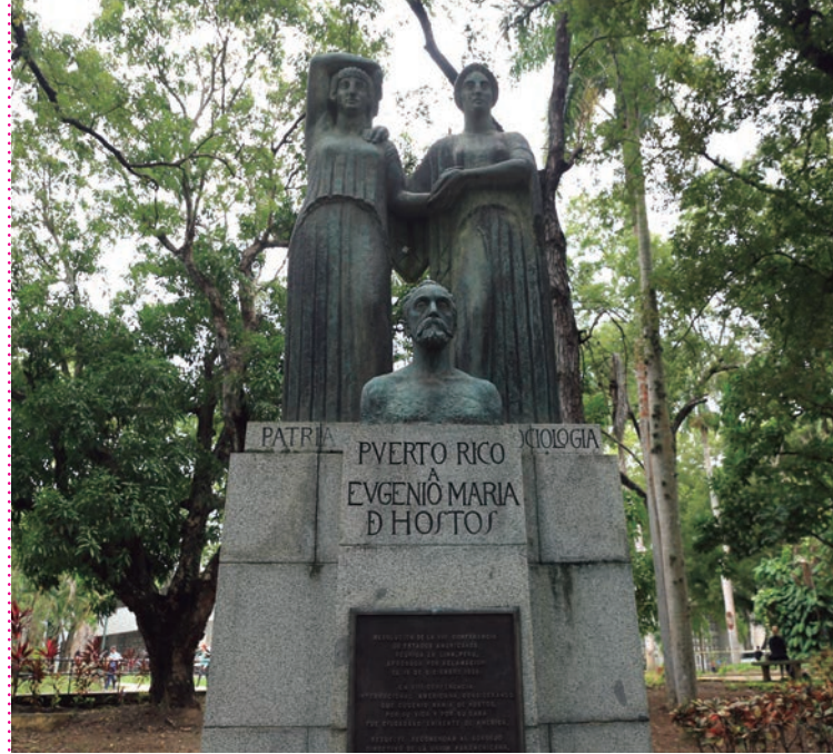
Monumento a Eugenio María de Hostos.