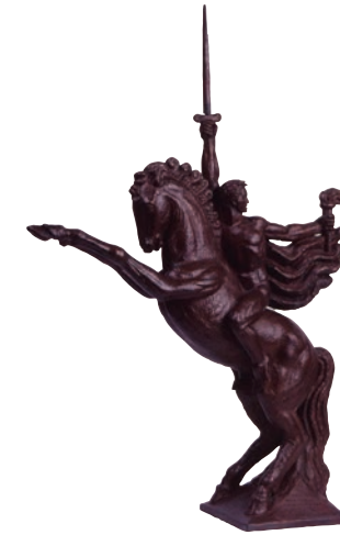
Grupo ecuestre. Boceto para el Monumento a Bolívar Yeso Diputación de Palencia