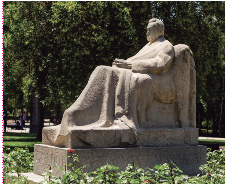
Monumento a Benito Pérez Galdós. Parque del Retiro (Madrid).

Sin olvidar tampoco su producción en el resto de España como el Monumento Funerario a Marcelino Menéndez Pelayo en la Catedral de Santander, el Monumento a Sebastián Elcano de Guetaria o el conocido Cristo del Otero , que levantó en 1927 en su Palencia natal, en realidad un Corazón de Jesús, que bendice a la ciudad desde el cerro, o su último monumento, el que levantó en la Plaza Mayor al escultor Alonso Berruguete, tan admirado por él.