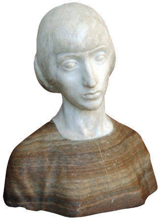
Busto de mujer Mármol blanco y alabastro de color Diputación de Palencia